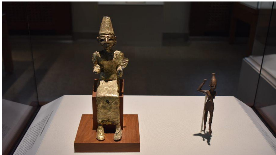
Figuras que representan a los dioses 'El y Ba'al (Megido, Instituto Oriental, Chicago)

En el libro de Crónicas, para reproducir en castellano el número plural de la palabra hebrea Ba'alim , se habla de Baales , lo cual parece sugerir una especie de sinécdoque; es decir, "la parte por el todo". En otras palabras, el término singular Ba'al es utilizado como una referencia genérica a varios dioses al mismo tiempo (o Ba'alim ), no como la referencia a un dios específico. Y esto sucedió posiblemente como parte de un proceso de relativa institucionalización y diversificación de la imagen de Ba'al entre los cananeos y el propio pueblo de Israel.