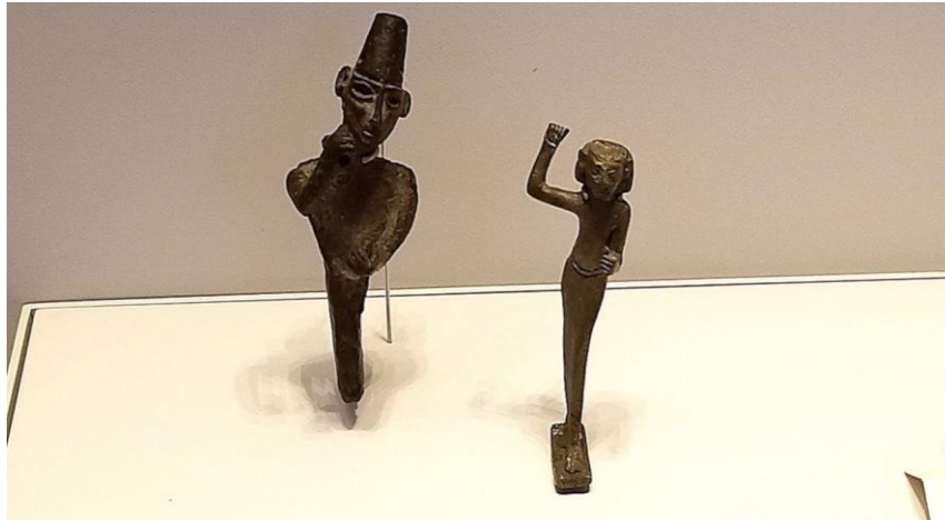
Posibles representaciones de 'El y Anat o אֱשֶׁרָה, en una posición similar a la adoptada por Ba'al (Tel Dan, siglo 19). XIII-XV ACE)