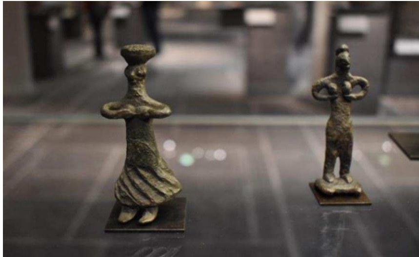
Figuras metálicas femeninas con posibles vínculos con la fertilidad o diosas ligadas a este concepto, y de entre las cuales אֲשֵׁרָה despusunta. Muchos textos bíblicos condenan la fabricación y adoración de estructuras metálicas como las que vemos aquí.